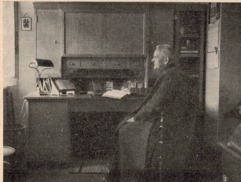
Der Jubilar jetzt

dankbaren Klosterfrauen? wer die zahlreichen lateinischen Widmungen ehemaliger Lateinschüler? Einzelne Klassen hatten ihrem jetzigen Lehrer schon vorher Sonderfeiern veranstaltet und ihre Wünsche in ciceroninischem Latein, in Hochdeutsch und Obwaldner Mundart, in Musik oder sonst in geistvoller Form zum Ausdruck gebracht. — Unser Kalligraph P. Ephrem